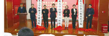
揭牌仪式上,中国科学院院士陆林教授、中华医学会精神医学分会主任委员李凌江教授等人以视频形式向本次深入合作表示了诚挚的祝福。