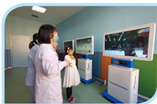
多媒体情景互动训练系统