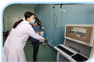
虚拟现实儿童注意力训练系统