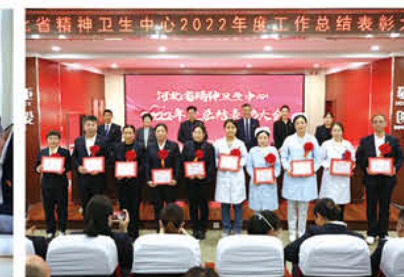
医院2022年度工作总结表彰大会