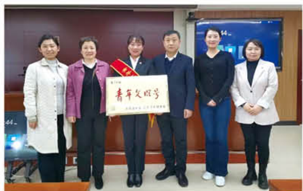
医院获得国家级“青年文明号”称号