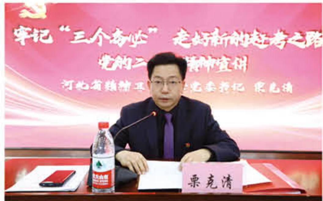
医院党委书记讲党课