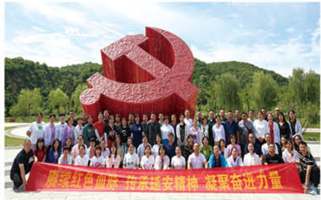
医院组织党员干部参观学功