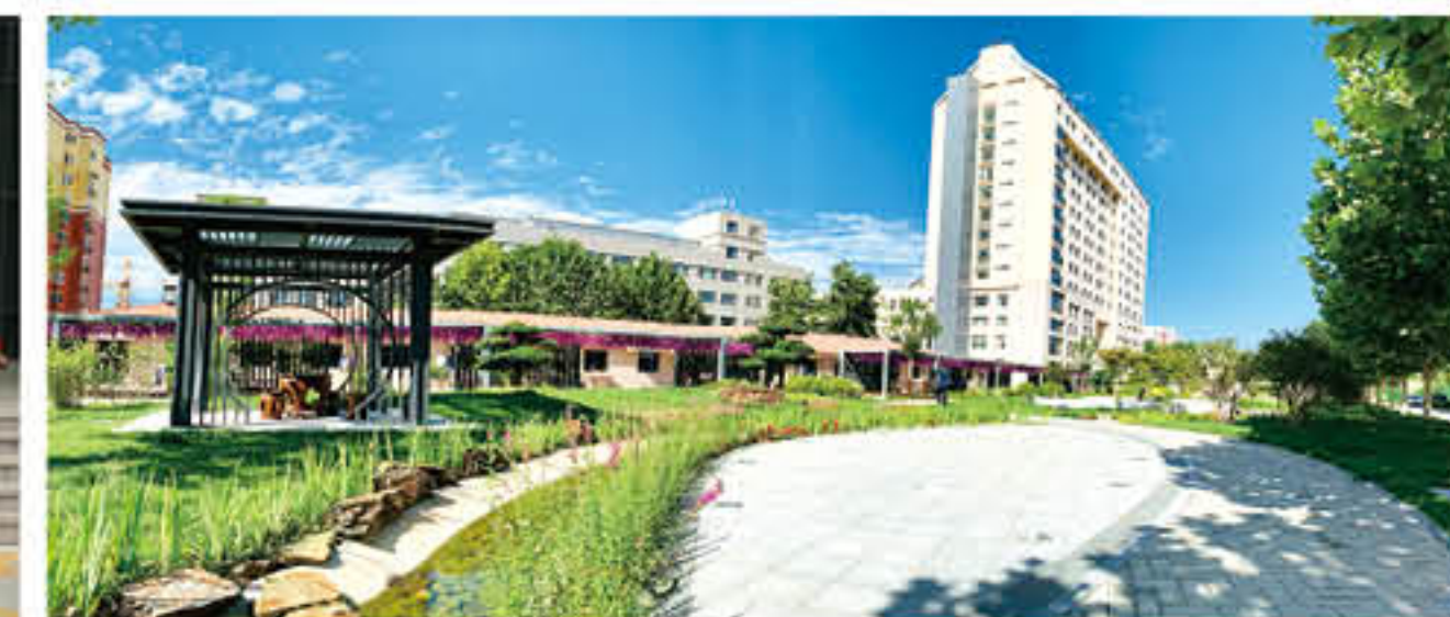
医院心理主题花园

实好“三会一课”制度，并突出做好服务党员和党员教育管理。严格按照“坚持标准、保证质量、慎重发展”的方针，及时制订发展党员计划，对入党申请人和积极分子进行重点教育培养，严格落实发展程序步骤。坚持深入党员群众，虚心听取意见，竭力解决党员群众需求。 积极开展“一支部一品牌”创建活动，组建党员先锋队，在突发事件应急心理救援、新冠疫情防控等重要工作中冲在前、当先锋、作表率。同时，广大党员带头落实医院及科室工作部署，虚心听取和反馈群众意见建议，自觉接受群众监督，积极提升业务能力，努力为医院发展建设贡献力量。以每年中国医师节、国际护士节组织的各类技能竞赛和优秀医师、护士评选活动为例，受表彰的个人中党员占比超过90%，充分彰显了党员模范带头作用。 党员主动亮身份，在为民服务中展现价值。一是推进服务型党组织建设，在全院窗口科室、职能处室设置党员示范岗，放置标牌，增强党员荣誉感和责任感，引导党员在工作中持续改进工作作风，提高服务质量。二是党员在岗必须佩戴党徽，并作为每天必须整理的仪容仪表内容，每名党员都要以爱心、耐心、细心、责任心服务患者，以实际行动自觉为党旗添彩，为党徽增色。三是以党员干部队伍为主体，充分发挥党员先锋模范带头作用，稳步推进实施“解锁工程、开心工程、牵手工程、心理热线、乡村振兴工作”五大惠民利民工程。 为了让党建工作更接地气更富活力，医院党委还创造性地运用一批新的党建平台，充实党建工作内容，丰富党建工作形式，使党建工作活起来。一是搭建共产党员微信群，打造开展党员教育的移动课堂平台。通过推送学习信息、分享学习内容、开展学习讨论，使其成为院党委开展党员教育的移动课堂，丰富了党员的学习交流形式，实现了党员学习交流“零距离”。二是为每名党员过好“政治生日”，打造院党委和党员间的互动交流平台，通过党员生日祝福，支部书记赠送生日礼物，举行重温入党誓词仪式等，提醒党员要铭