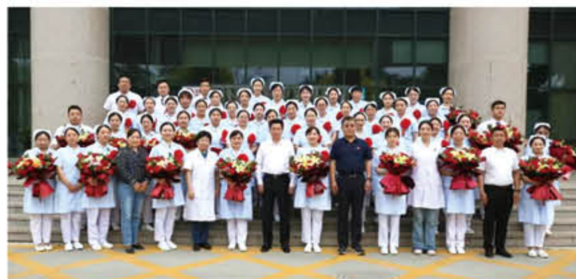
医院领导与护士节受表彰人员合影