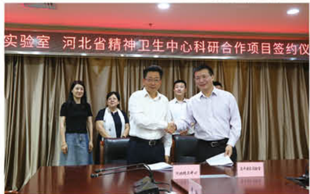
医院与昌平实验室签约