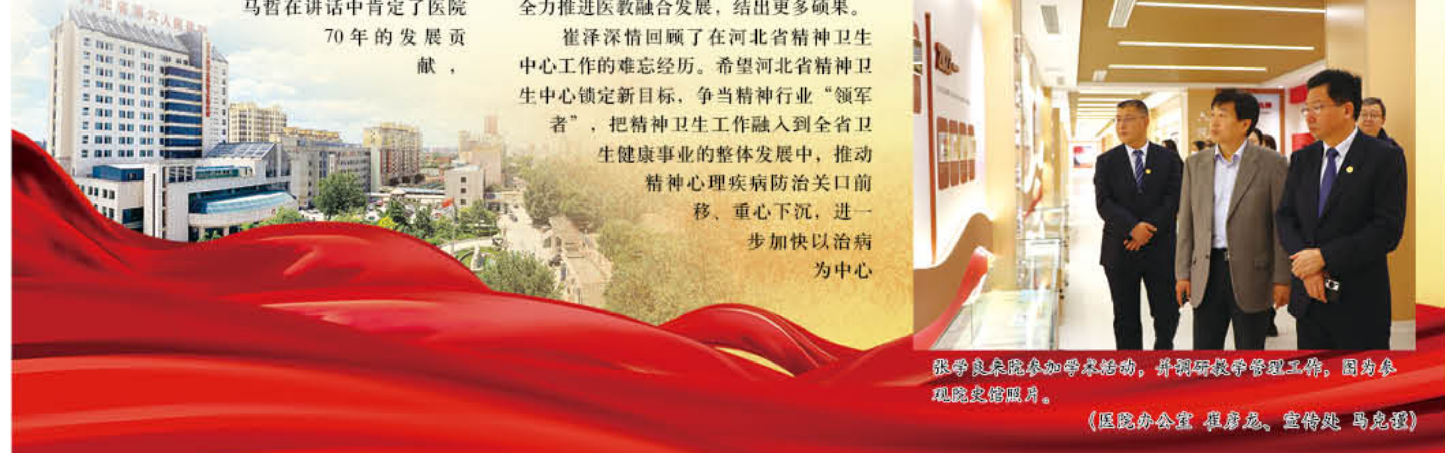
张洪亮、邵静、常静等专家参加活动，并围绕护理管理工作，围绕为医院发展建言献策。（医院办公室 崔蔚晨、宣传处 马恩程）

会上，与会领导为各地市精神疾病专科医院赠送《现代精神专科医院管理体系文件汇编丛书》。本次活动还设置了睡眠医学和医院管理专场，并组织召开了《临床专科能力建设系列蓝皮书——精神医学临床专科发展报告》第三次编委会。来自全国各地一百余家医疗机构的340余名同道及19家国家级、省级媒体朋友参加了本次学术活动。