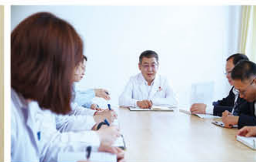
医院院长进行行政查房